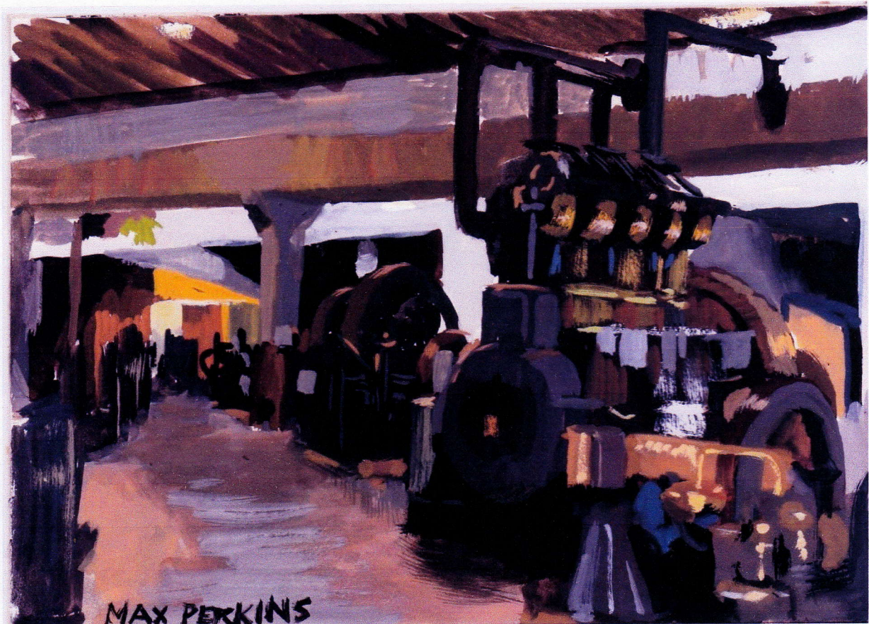
Vue d'artiste du Muséum

Peu à peu les artistes y ont trouvé un intérêt : d'abord il y avait là les moyens de faire faire quelques réparations par exemple sur un cadre abimé, ou sur une soudure mal réalisée; de plus il y avait aussi là des sujets d'inspiration et une vaste salle d'expositions.