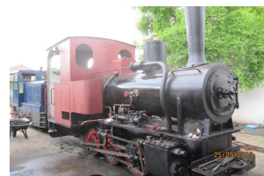
La 030 T Oreinstein & Koppel ↗

Le CFC, pour sa part, mettra en ligne ses machines à vapeur Decauville 030 T « Chanteraine » de 1920, Decauville/Borsig 020 T « Tabamar » de 1911 et, en vedette, l'Oreinstein & Koppel 030 T de 1914 qui, après sa réfection totale, notamment l'installation d'une chaudière neuve, reprend du service après des années d'inactivité. Après des centaines d'heures de travail acharné, nous aurons le grand plaisir de procéder à une amicale cérémonie d'inauguration de cette superbe machine.