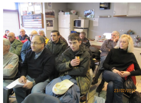
Assemblée générale du CFC – février 2013