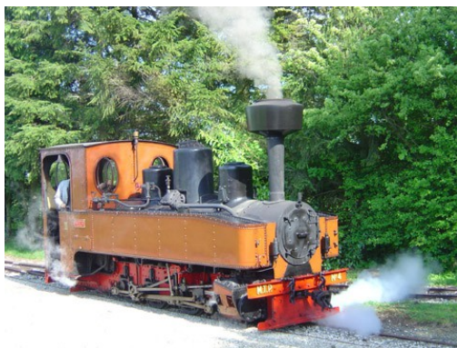
la 040 T de l'AMTP ↗