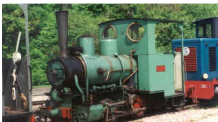
la 020 T « Tabamar » du CFC ↗

Manfred Schaible, grand ami du CFC, sera aussi des nôtres avec son magnifique autorail